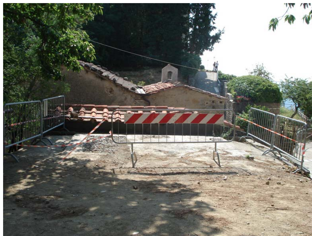
F1: PRIMA DELL'INTERVENTO