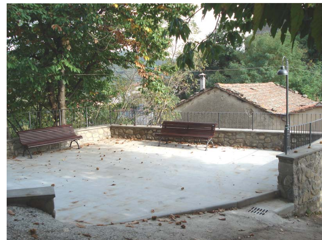
F.1 DOPO L'INTERVENTO