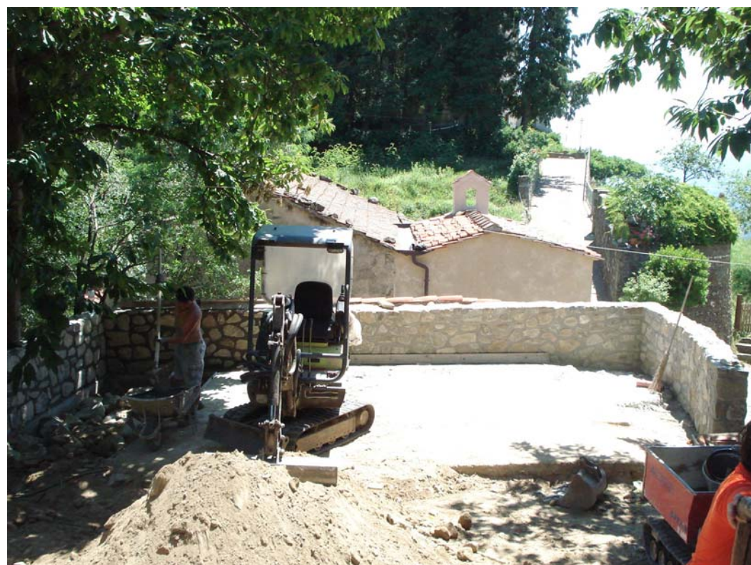
F.1: LAVORI IN CORSO