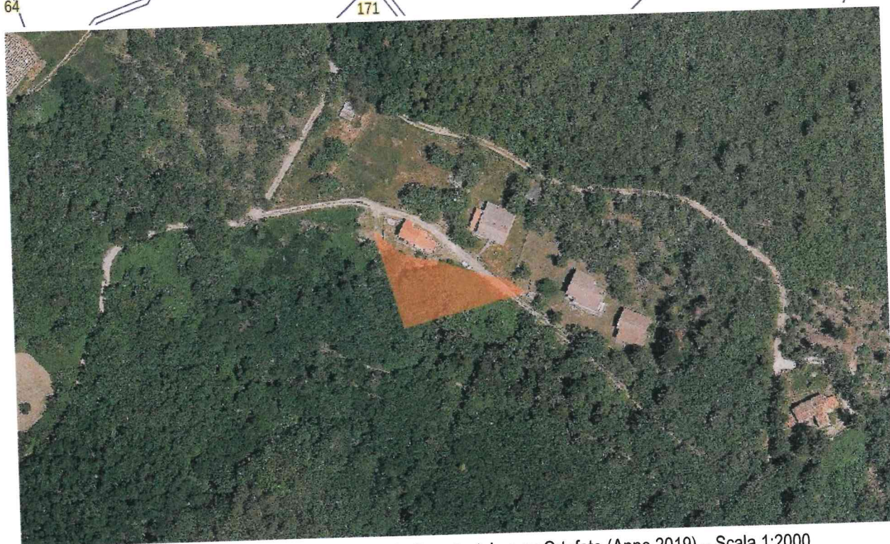
Individuazione delle Aree percorse da incendi su estratto catastale e su Ortofoto (Anno 2019) – Scala 1:2000

Data incendio: 02/04/2020 Ora evento: 15:26 Data rilevamento: 23/06/2020