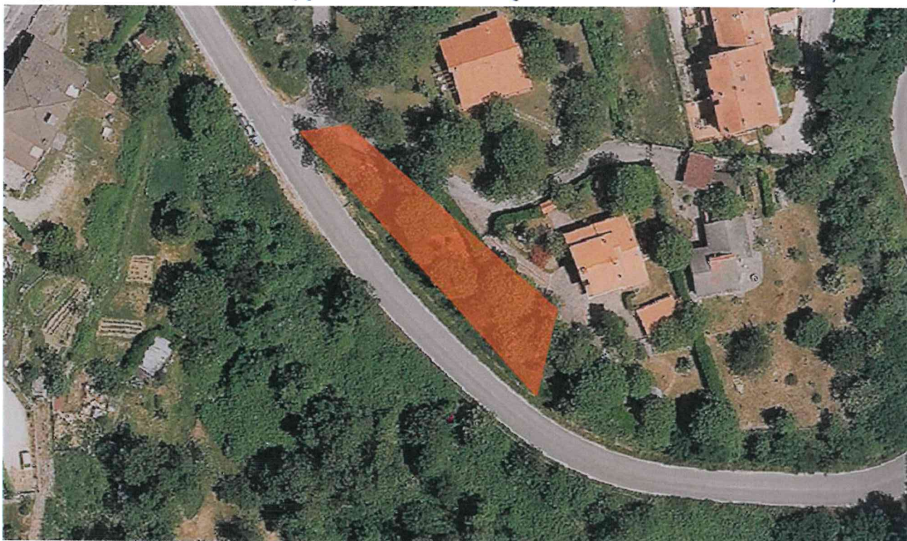
Individuazione delle Aree percorse da incendi su estratto catastale e su Ortofoto (Anno 2019) – Scala 1:1000