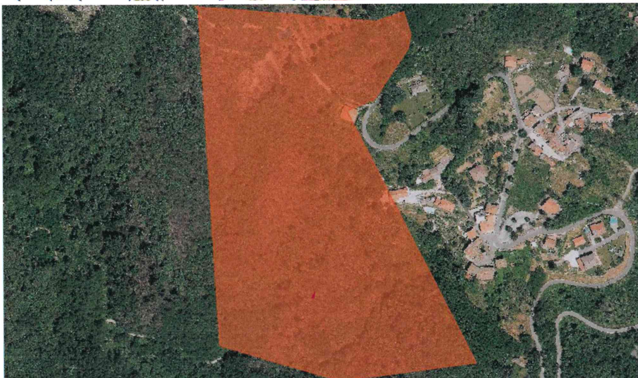
Individuazione delle Aree percorse da incendi su estratto catastale e su Ortofoto (Anno 2019) – Scala 1:4000